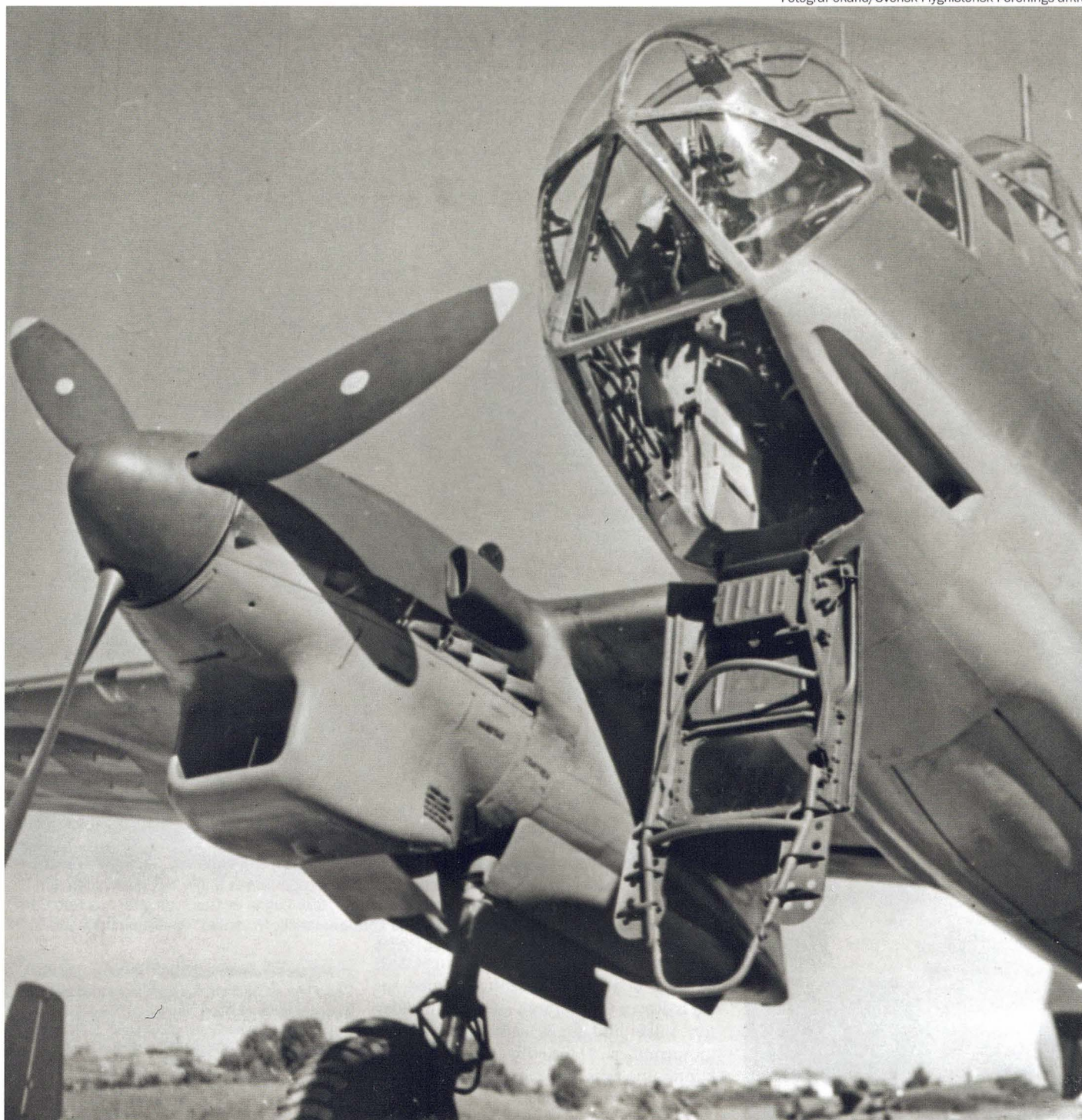
Dags för ombordstigning! Saab T 18B konstruerades som torpedflygplan, men kom i stället att tjänstgöra som attackflygplan på F 17 åren 1947 - 1957.