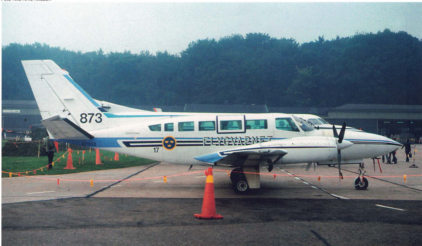
TP 87 var flygvapnets typbeteckning på Cessna 404 Titan II. Detta exemplar tillhörde F 17 mellan 1984 och 1989.

sera två robotgrupper med krigsgrupperingsplatser nära Blekinge-Skånekusten. Vid övningar användes Bräkne-Hoby i Blekinge, som undantogs från den annars mycket stränga sekretess som rådde kring dessa platser. 1974 omvandlades divisionen till robotbataljon, som fanns kvar till den 30 juni 1978.