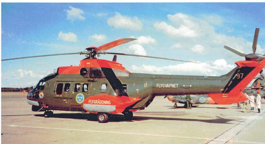
Hkp 10 Super Puma kom till F 17 1990. Som mest disponerade F 17 sex exemplar. I bakgrunden syns en Sk 50 Safir.