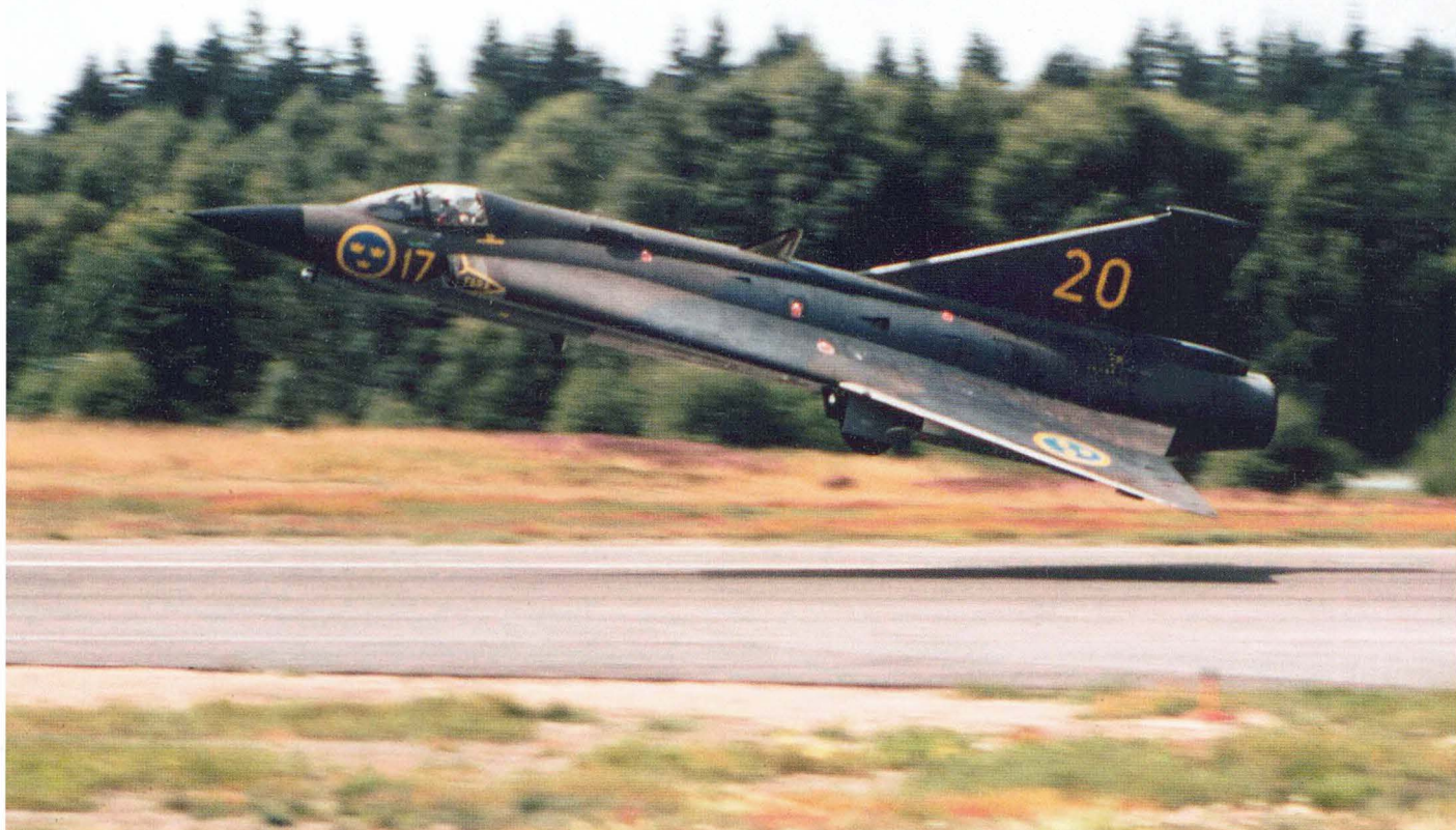
När två av F 17:s divisioner gick över från attack till jakt utrustades de 1973 med J 35F Draken, men en Lansendivision fanns kvar till 1975.

en Hkp 3 Agusta-Bell 204. Efter diverse omorganisationer fanns under en period från 1971 en helikopterdivision. Som en parentes kan också nämnas att Flygskolan (FlygS) med SK 60 på Malmen administrativt tillhörde F 17 mellan 1 juli 2003 och 1 januari 2006, då ansvaret överlämnades till Luftstridsskolan (LSS) i Uppsala.